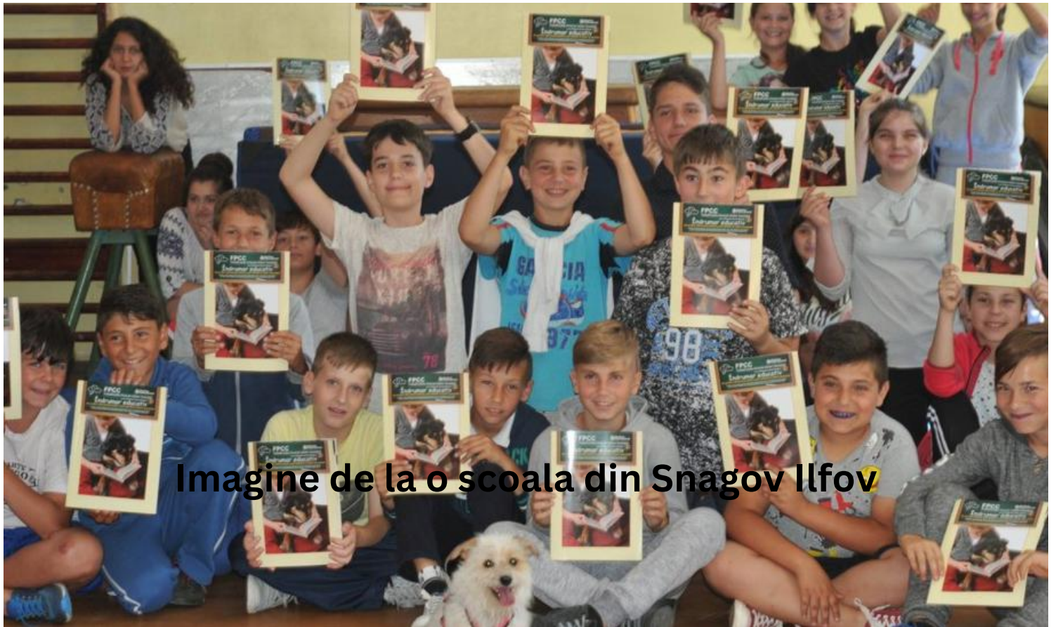
Imagine de la o scoala din Snagov Ilfov

In 2022 am atins cifra de 18000 de brosure educative pe care le-am oferit gratuit cadrelor didactice si asociatiilor de profil din tara pentru a fi folosite in programele cu copiii.